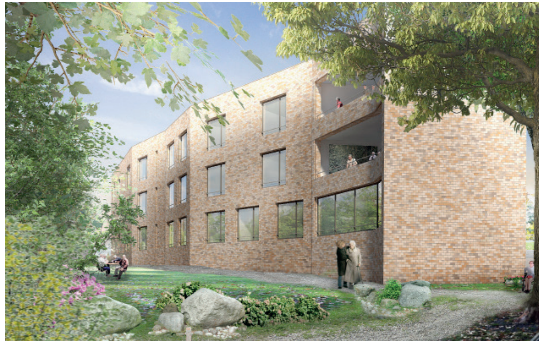
Freiraum zum Wald